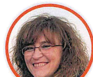
MARIANGELA MAPELLI SCUOLA PRIMARIA