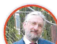
MASSIMO TAVOLA SECONDARIA DI PRIMO GRADO