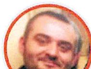
ROBERTO ZOLLO SCUOLA PRIMARIA