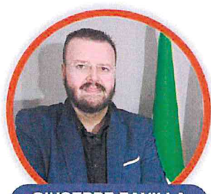
GIUSEPPE FAVILLA SECONDARIA DI SECONDO GRADO

DOCENTI, ATA, INSEGNANTI DI RELIGIONE PER LA SCUOLA